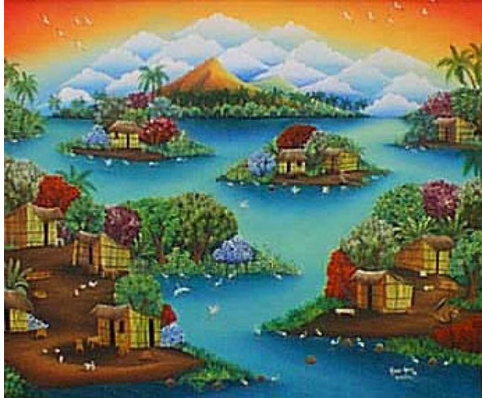
Las Isletas y en el fondo la Isla de Zapatera